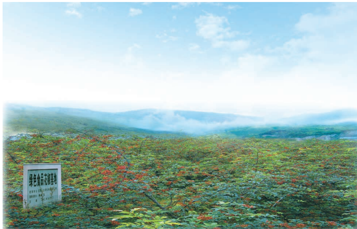
绿色食品花椒基地