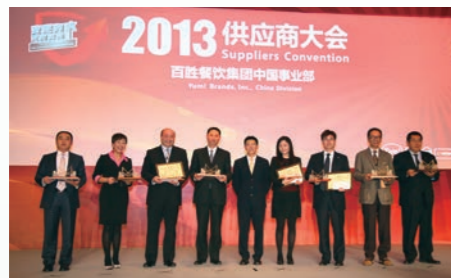
知味在百胜餐饮集团供应商大会上荣获造桥人金奖

杭州五丰联合肉类有限公司旗下的知味公司建立、实施并保持的体系有ISO9001、GMP、SSOP、ISO22000、STAR等，对食品安全实行从原料到餐桌的全方位管理：