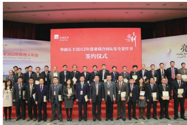
华润五丰 2012 年度安全责任书签署仪式

华润五丰针对各事业部及各下属利润中心的特点，首次制定与其行业相符的考核指标、工作要求以及“红线”，完成个性化《安全环保责任书》，3月16日华润五丰CEO与各职能部门、各事业部及各下属利润中心负责人签署共34份《安全环保责任书》。安全责任覆盖各事业部、职能部门和下属利润中心，做到安全责任“纵向到底，横向到边”，体现“谁主管、谁负责”、“管生产必须管安全”的原则。