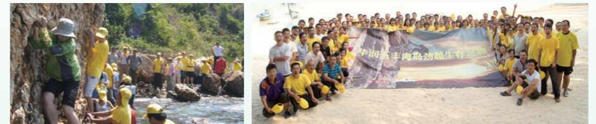
海岛劲越生存之旅

2012年9月15日-16日，华润五丰总部、五丰食品(深圳)有限公司管理团队、华润五丰营销(深圳)有限公司以及华润五丰人力资源信息化项目组成员共约120人齐聚大亚湾喜洲岛，开展华润五丰海岛劲越生存之旅。