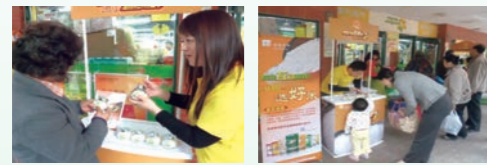
华润五丰欢乐社区行

华润五丰营销(深圳)有限公司是华润五丰旗下以大米加工、分销为主营业务的利润中心。2012年12月,该利润中心在深圳龙岗四季花城社区、罗湖嘉宝田社区、布吉东大街社区、布吉可园社区等社区开展“华润五丰欢乐社区行”活动。活动期间,通过试吃品尝、选好米方法推荐、与消费者游戏互动等现场活动,不但让消费者学会如何挑选、识别优质大米,还让其进一步了解大米产品营养知识。