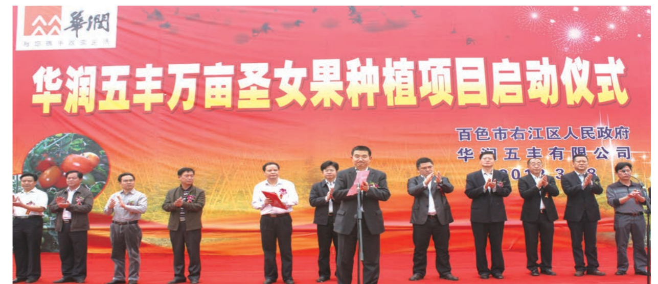
华润五丰万亩圣女果种植项目启动仪式