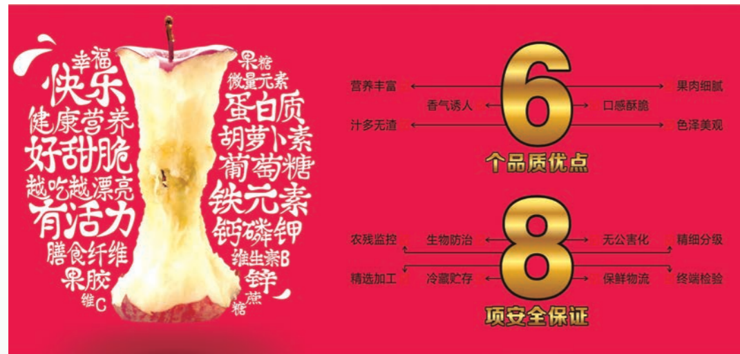
五丰苹果的营养推广策略与品质安全