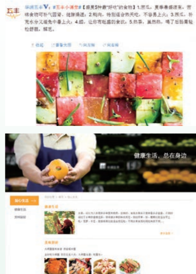
华润五丰官微、官网

华润五丰不仅为大众提供安全、健康、便捷的食品,更从关爱消费者的角度出发,为消费者提供健康饮食的解决方案,创造健康美好生活。公司利用自媒体平台——官方网站、微博与消费者沟通,在官微上开设“五丰小课堂”话题,每天分享饮食相关的科普知识、小贴士,同时在官网搭建“贴心生活”栏目,分享健康贴士、美味食谱等,持续宣传健康饮食的科普知识,倡导科学膳食、健康生活的理念。