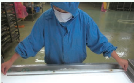
检验检疫局进行质量安全大检查